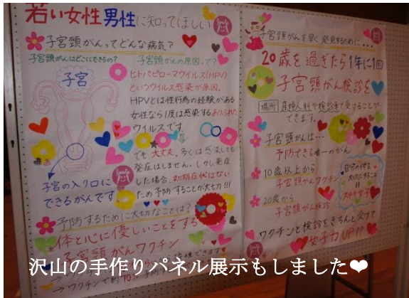
沢山の手作りパネル展示もしました♡