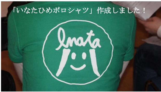
「いなたひめポロシャツ」作成しました！