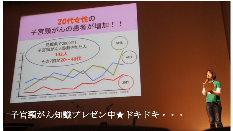
子宮頸がん知識プレゼン中★ドキドキ・・・