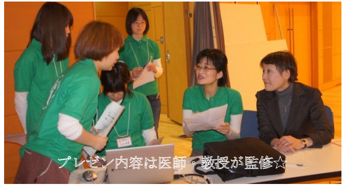
プレゼン内容は医師・教授が監修☆