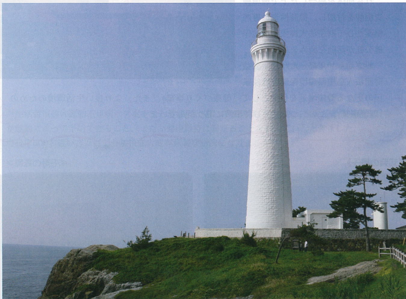
出雲市：日御碕灯台