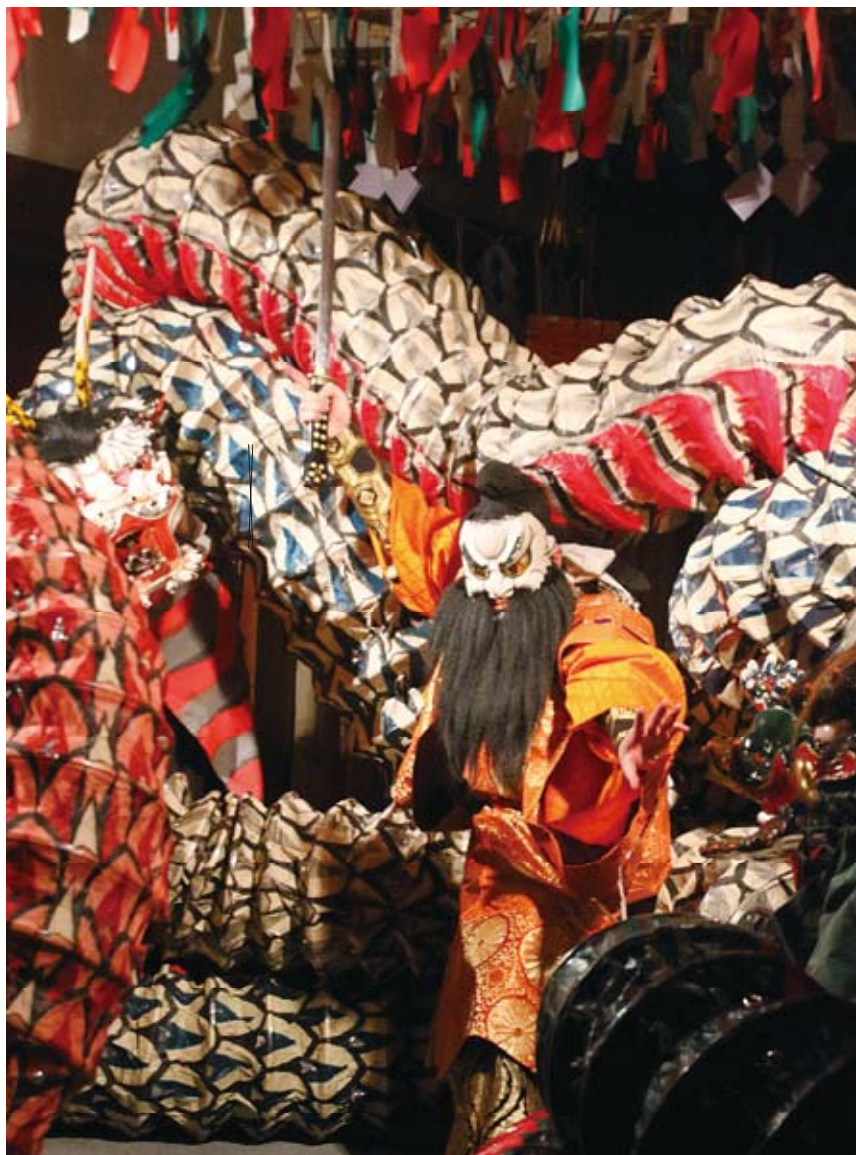
石見神楽 温泉津町