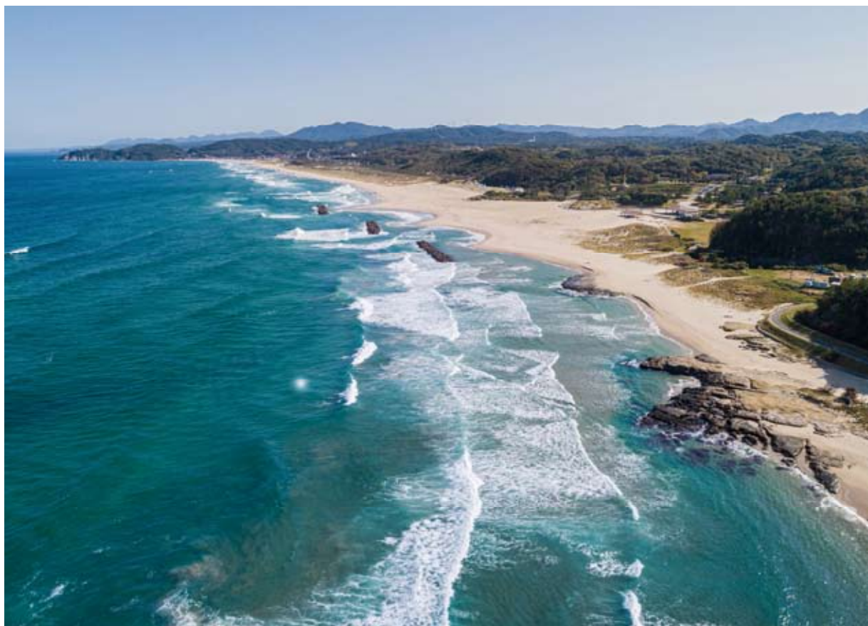
石見海浜公園 浜田市