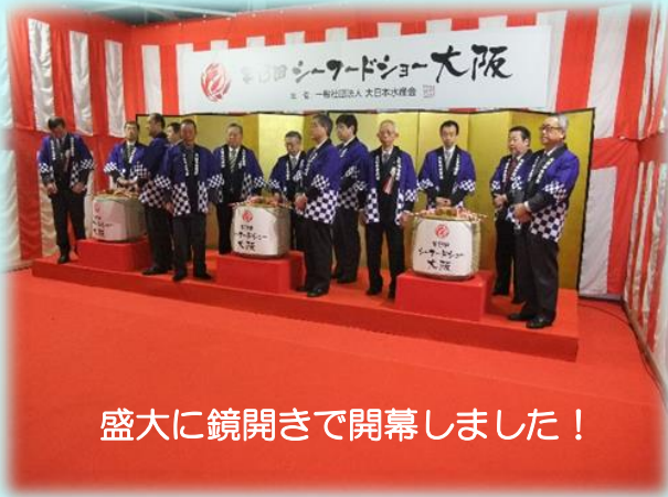
盛大に鏡開きで開幕しました！

西日本最大級の食材見本市として名高いシーフードショー大阪に初めて出展者として参加しました。西日本のみならず全国から多くの食品に携わる企業の参加があり、延2日間でおよそ1万5千人もの来場者を記録しています。当社は食品検査機関として島根県ブースの一員として参加しました。島根県の多くの出展者の方々とともに、島根県のPRもかねて協力して盛り上げていきました。