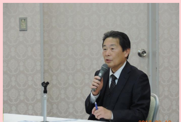
座長 島根県環境保健公社医療技監 (総合健診センター所長) 足立先生