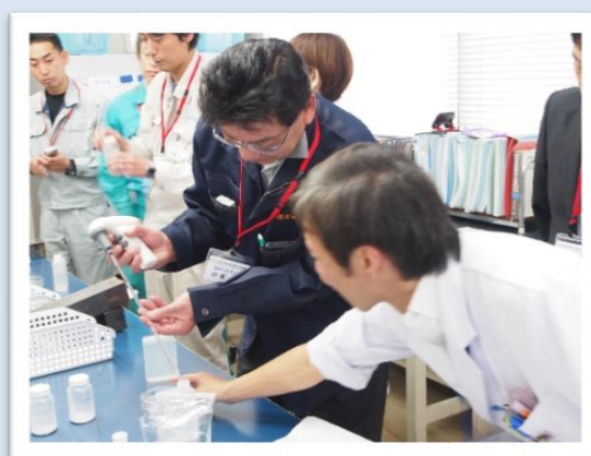
【検査実習】 臭気検査実習、色濁検査実習 細菌検査実習、採水実習

水道事業に関する講演や事例発表、水質検査についての情報提供や検査実習等、今後も主催していきます。