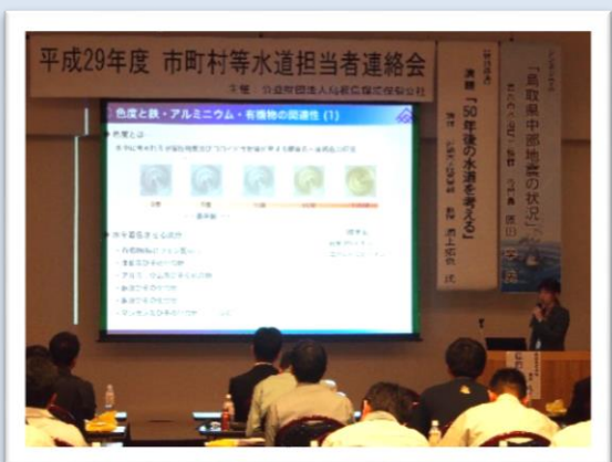
【情報提供】 「検査項目の関連性と水質情報」 「水質検査方法と検査機器」