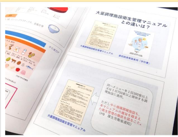
【第1部講演】 「HACCPの考え方を取り入れた衛生管理について」講演内容