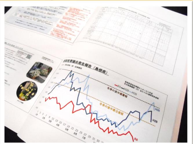
【第2部講演】 「給食現場で注意しなければならないハザードとその対策」講演内容